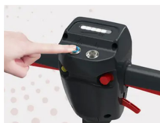
Einfache und klare Bedienung Besonders anwenderfreundlich