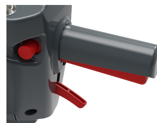
Farbcodierte Bedienelemente Bedienergeführte Touch-Points