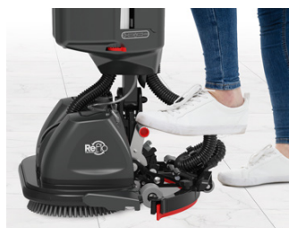
Fußbedienung Saugbalken lässt sich einfach mit dem Fuß absenken und hochstellen