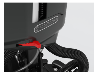
Einstellbarer Wasserverbrauch Einstellbarer Wasserdurchfluss je nach Reinigungsbedarf