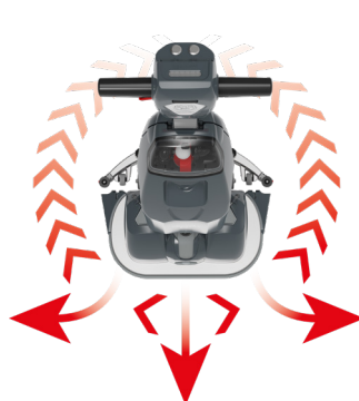
Agile Manövrierfähigkeit Besonders randnahes Arbeiten möglich